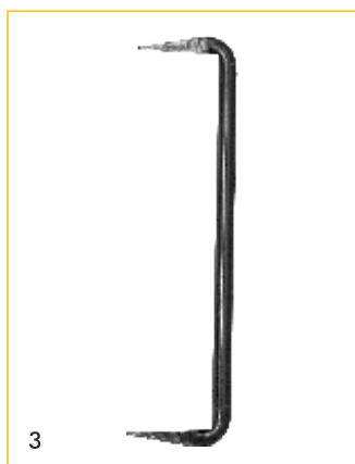
Gerüstklammern, Abb. 3