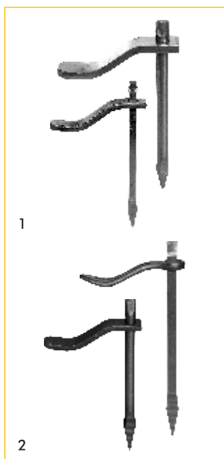
Mauerputzhaken (verstellbar), Abb. 1 und 2